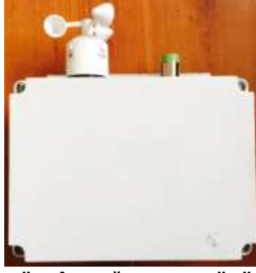
RÜZGÂR-YAĞMUR SENSÖRÜ (10m kablo ile)