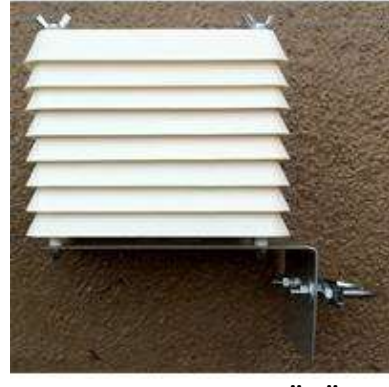
SICAKLIK-NEM SENSÖRÜ (40m kablo ile)